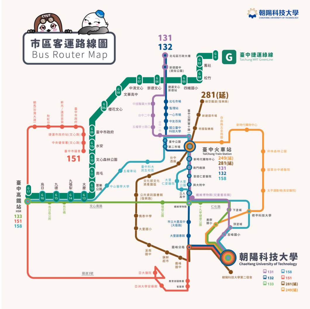
圖 2 朝陽科技大學直達公車路線圖