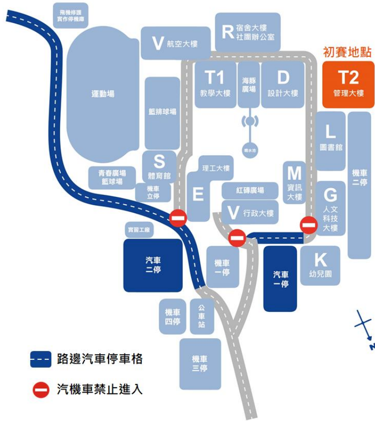
圖 4 朝陽科技大學校園平面圖