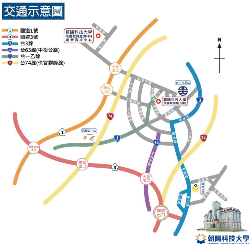
圖 1 朝陽科技大學交通示意圖