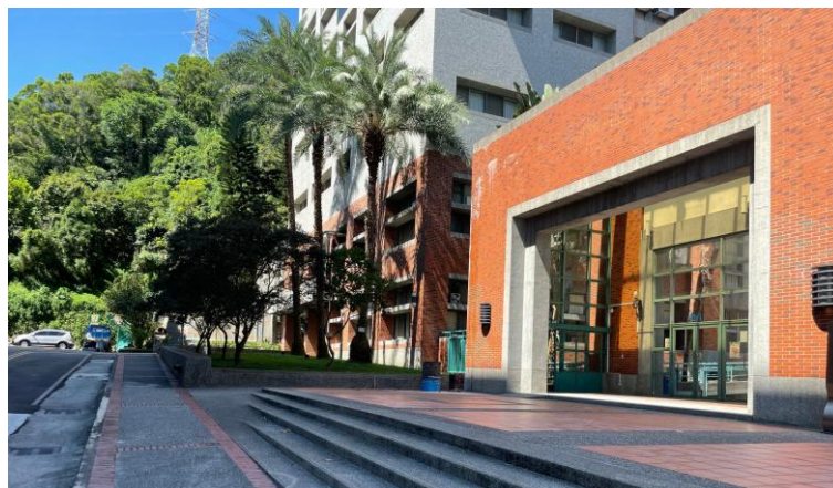
圖 3 朝陽科技大學 T2 管理大樓

競賽場地設於 T2 管理大樓如圖 3，校園內有免費汽車停車場，包含第一、第二汽車停車場及路邊停車格（藍色虛線區域），校園平面圖如圖 4。