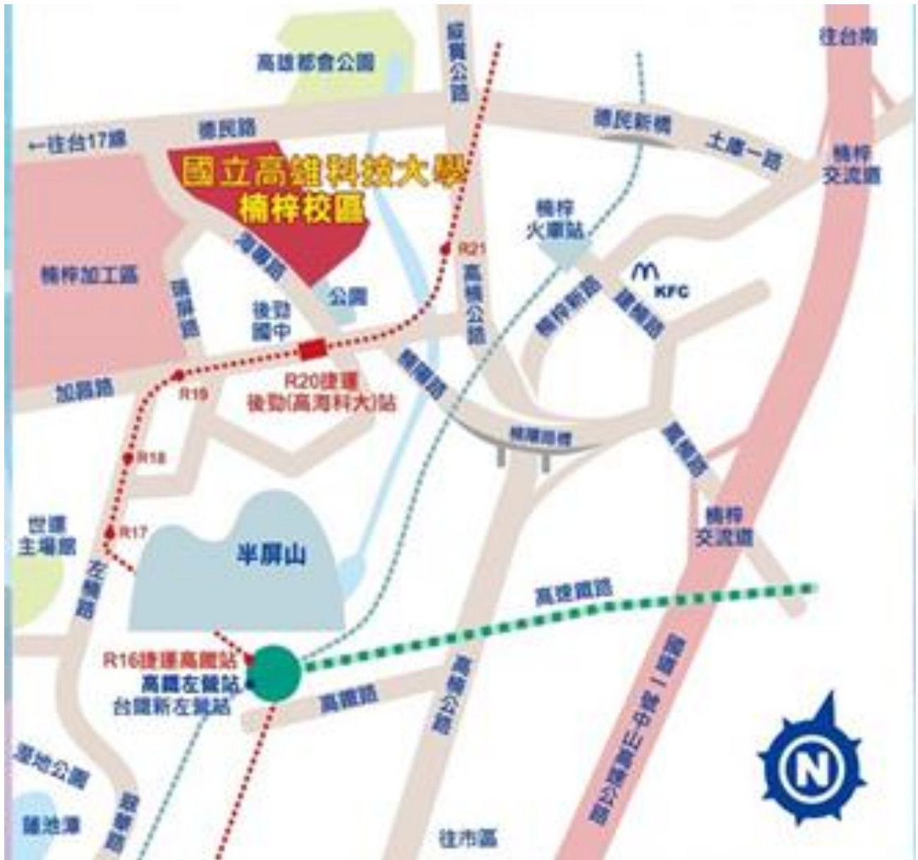
附件 2 本校楠梓校區交通示意圖