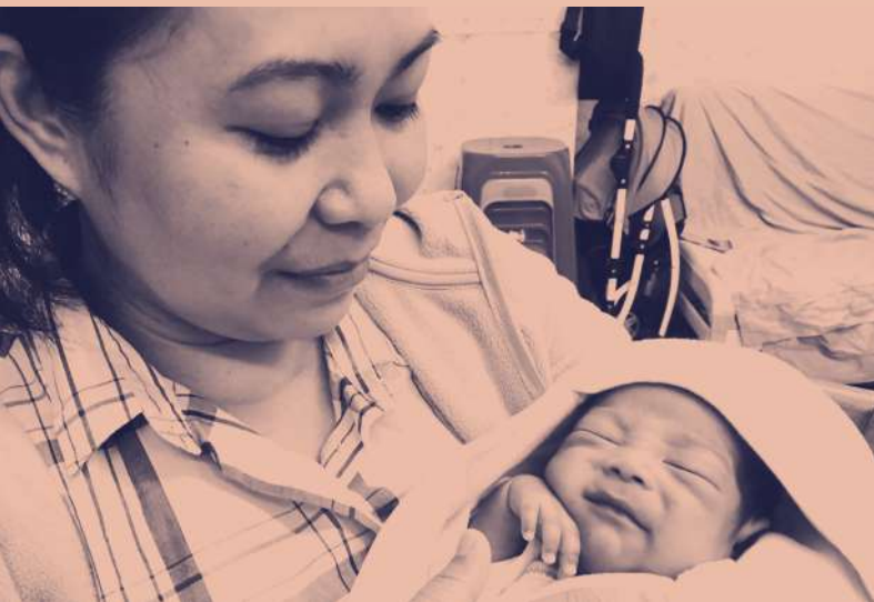
▼ 桃群安置的移工媽媽之一，因懷孕遭不當解雇