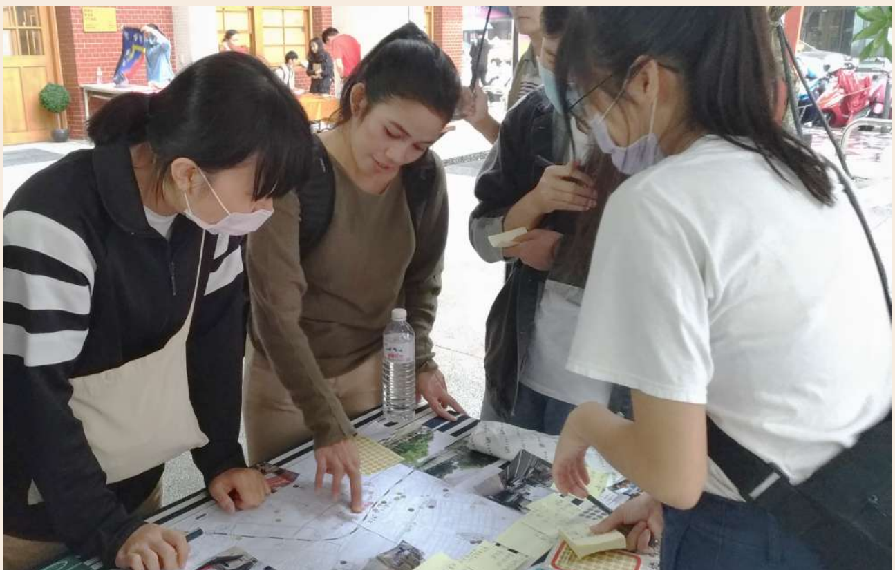
◀ 移工們利用貼點點的方式指出平常的生活範圍

最後，連老師希望同學在設計計畫及做決策時要學會換位思考，也想告訴大家，我們生活的角落有許多移工及弱勢族群，期待越來越多人可以注意到身邊各種人文風景、生活細節，並試著去體會，為他人著想。如同這門課程的目標，瞭解不同文化的差異，創造共融的社會。