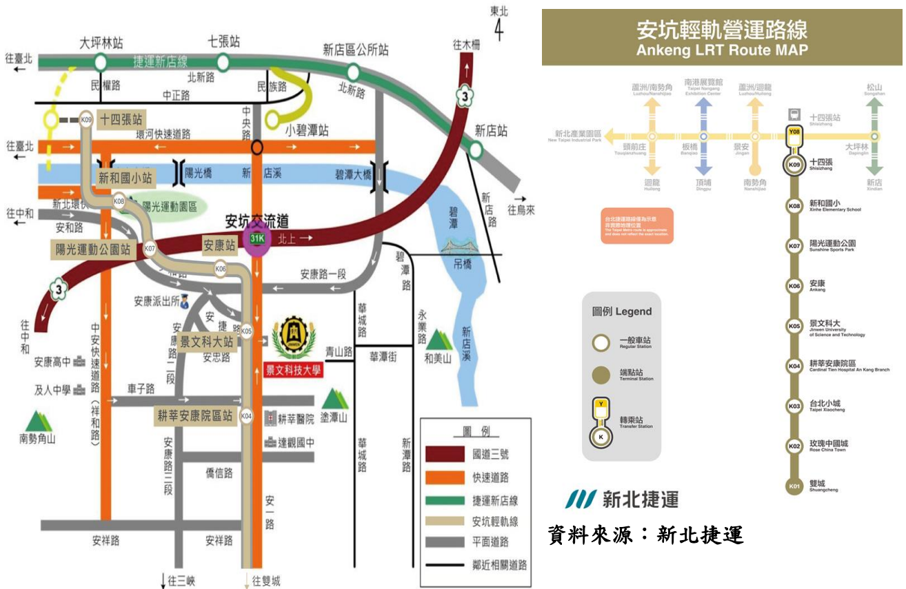
新北捷運