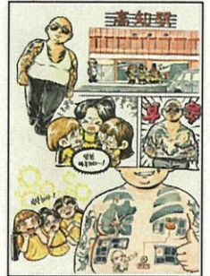
全南女子高等学校(韓国)