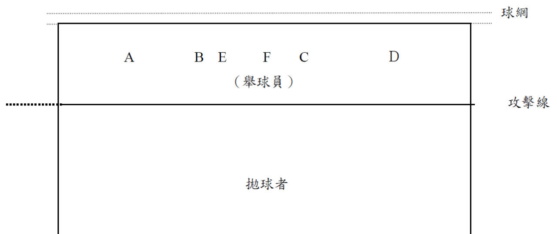
圖二 排球攻擊手快攻位置示意圖