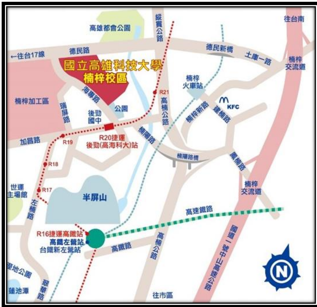
附件 6 本校楠梓校區交通示意圖